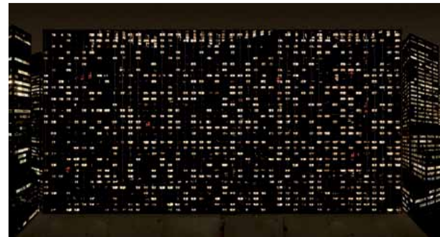
Avenue of the Americas, Andreas Gursky