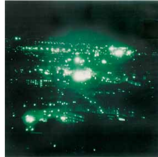
Nacht 20 1, Thomas Ruff, 1995