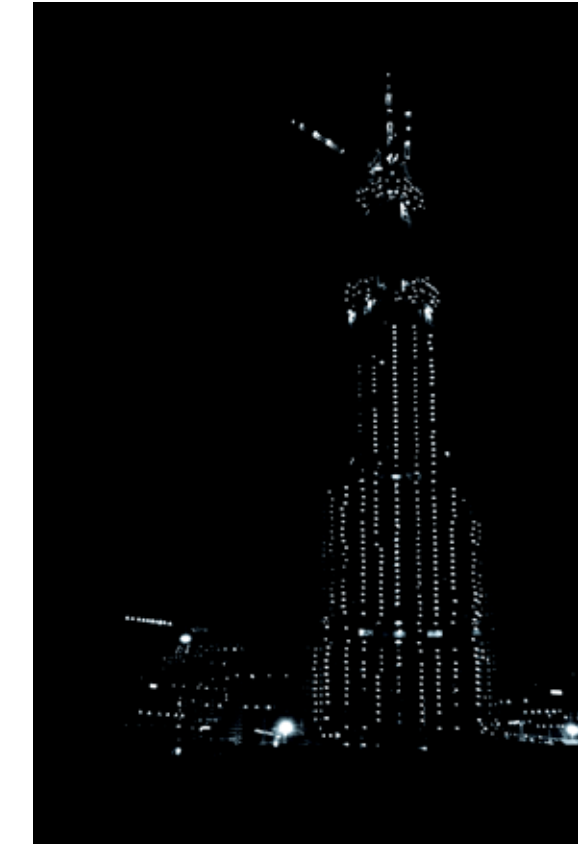
Burj Flavin-Tatlin, Susanne Schuricht, 2006